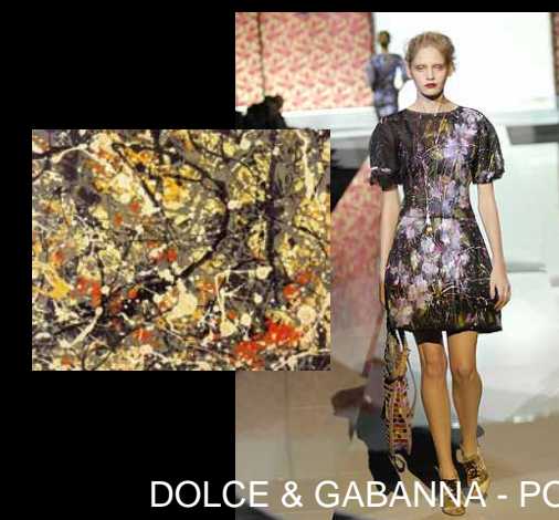
DOLCE & GABBANA - POLLOCK