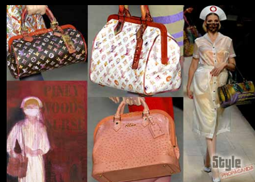
LOUIS VUITTON - RICHARD PRINCE