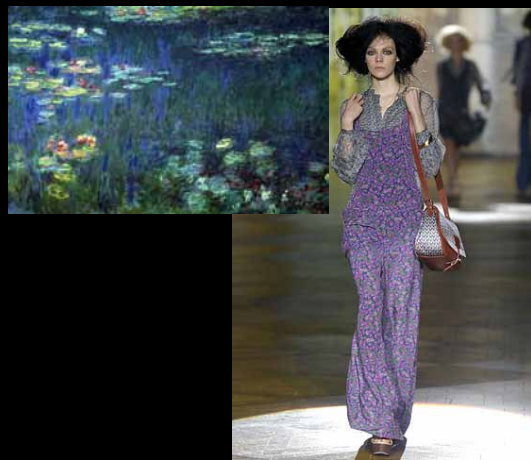
ROBERTO CAVALLI - MONET