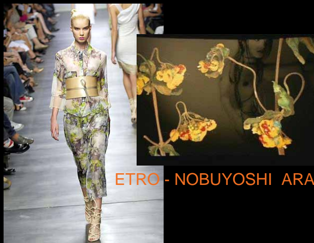
ETRO - NOBUYOSHI ARAKI